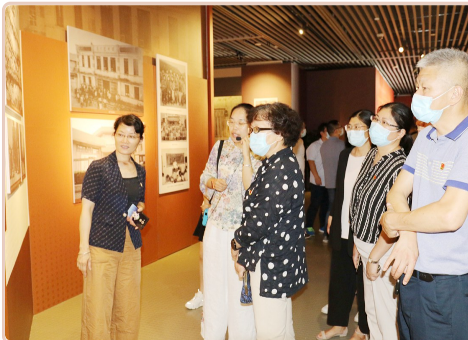
红色基因永相传 「月」日下午,区卫健系统机关党总支组织党员、入党积极分子和入党积极分子前往金山区博物馆参观「开天辟地 百年伟业」特展,传承红色基因,汲取前行力量,走好新时代长征路。

区卫健委、区妇联、区妇幼所分别汇报了上半年度妇女“两病”筛查工作开展情况和下阶段工作计划。