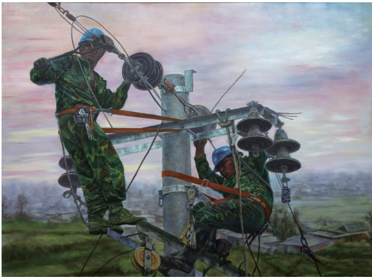
迎朝霞，抢修忙（油画） 庞军 绘

在这个飒飒金风、芦荻漫舞的秋日，无意间与田间野蔬“邂逅”，这舌尖上的乡野野肴，由味蕾漫过心间，一次次让我神归故土，情思悠悠。这秋“吃鲜儿”，竟也让我品出生活的万般滋味。