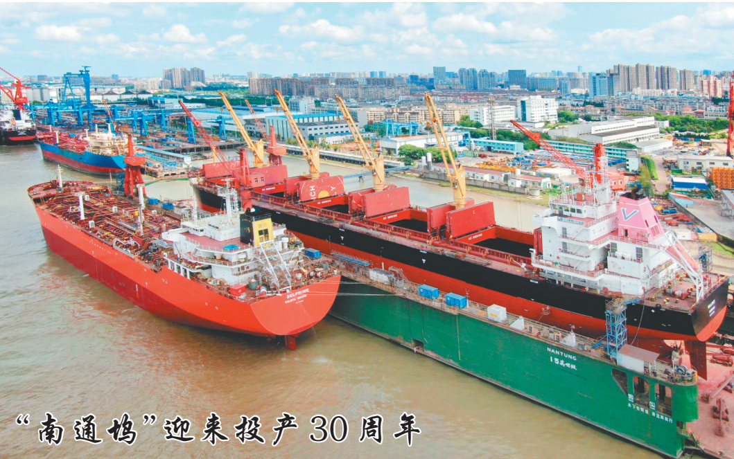
“南通号”迎来投产30周年

组建纠纷化解专业队,推动调解提质。创新建立人员互聘和培训互邀的合作方式。工会主动聘请退休法官、仲裁员及现任专职调解员等担任劳动争议调解员或顾问。司法行政部门选聘工会工作人员担任调解员和人民陪审员,协助开展业务工作,仲裁委依法聘请工会工作人员担任兼职仲裁员,提升队伍专业化水