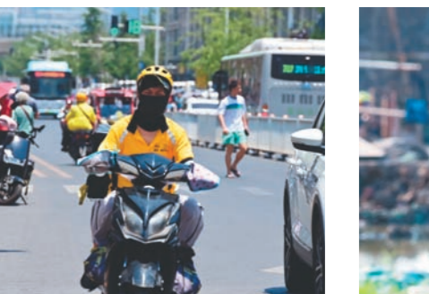
正午时分，外卖骑手顶着烈日送餐。