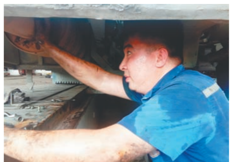
南京公交浦口客运站机江浦客运站站台的维修车间内，修理工正在几乎不透风的机坪内检修车辆。