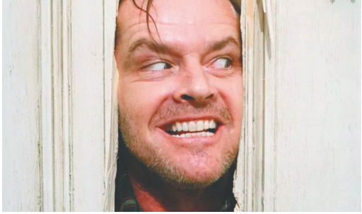
杰克·尼克森的表演炉火纯青

作为全球最为著名的电影产业，好莱坞涌现了许多伟大的演员，这些演员不仅在银幕上表现出色，而且在世界纪录方面也取得了让人惊叹的成就。