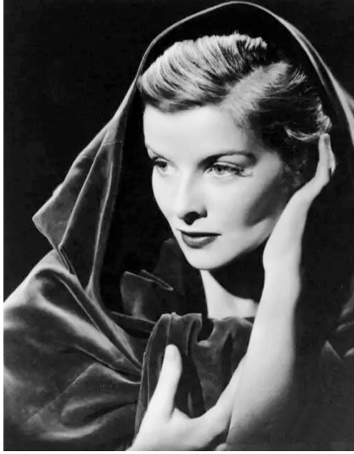
凯瑟琳·赫本四次荣膺奥斯卡最佳女演员荣誉