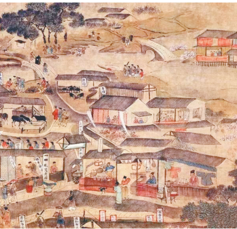
明代南京繁华的国际市场(南都繁会图局部)

张骞凿通的陆上丝绸之路从葱岭、喀什、库车、哈密、玉门、敦煌、酒泉、张掖、天水到西安,西安是丝绸之路的都城。那么从北海、湛江、广州、潮州、漳州、泉州、福州、温州、宁波、扬州、蓬莱,则应该奉南京为海上丝绸之路的都城。因为中国的两位海上帝王孙权和朱棣都在南京发布航海命令,朱棣命令郑和航海的敕