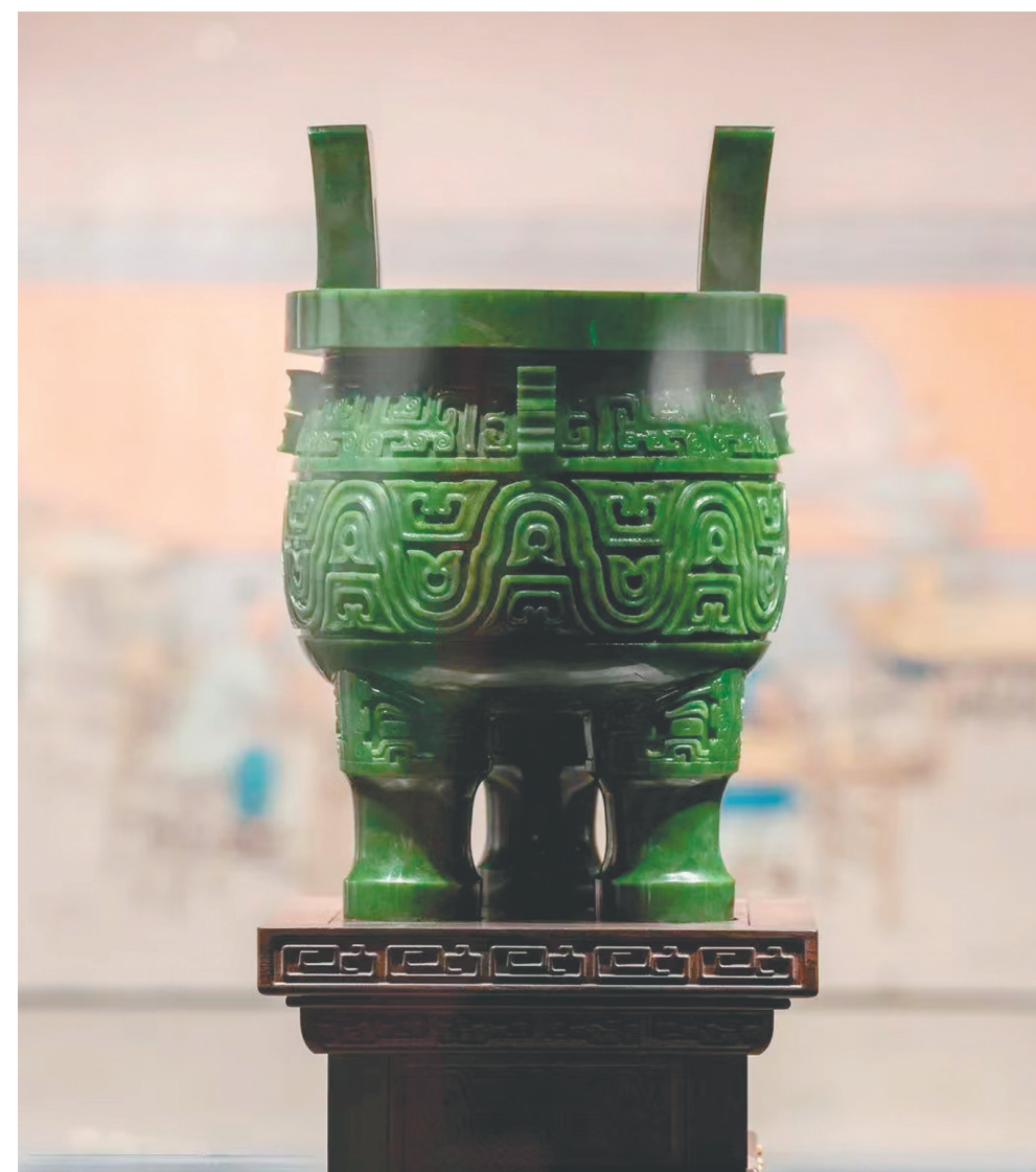
玉雕大师顾永骏作品