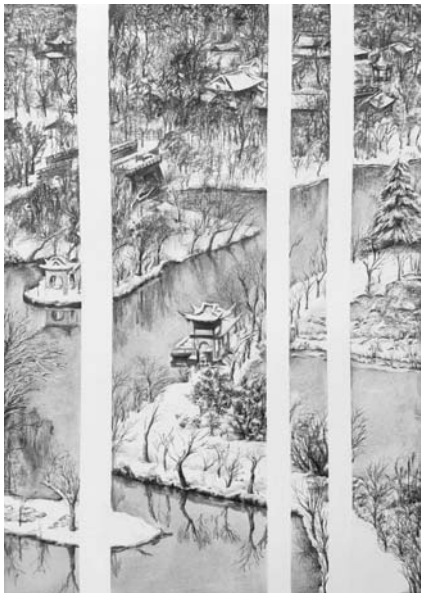
风景素描/冬将尽，春可期——金陵雪 陈敏