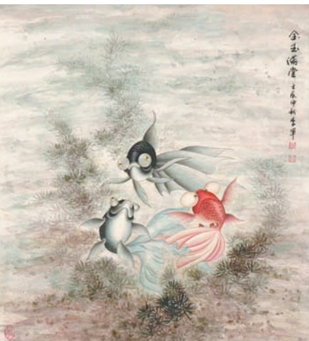
国画/金玉满堂 李军