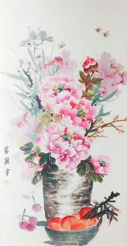
国画/富贵平安 常颖

大江東去浪淘盡千古風流人物故壘西 邊人道是三國周郎赤壁亂石穿空驚濤 裂岸捲起千堆雪江山如畫一時多少豪 傑遙想公瑾當年小喬初嫁了雄姿英 羽扇綸巾談笑間檣櫓灰飛煙滅故國神 遊多情應笑我早生華髮人間如夢一 還酹江月 宋蘇軾念奴嬌赤壁懷古 彭玉香 歲次甲辰時序仲春於鍾山麓敬古軒 彭玉香即興書之