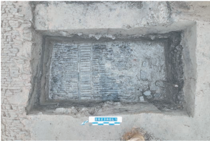
一层路面下的又一层路面