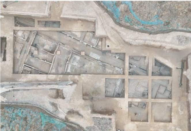
新路遗址发掘区航拍图