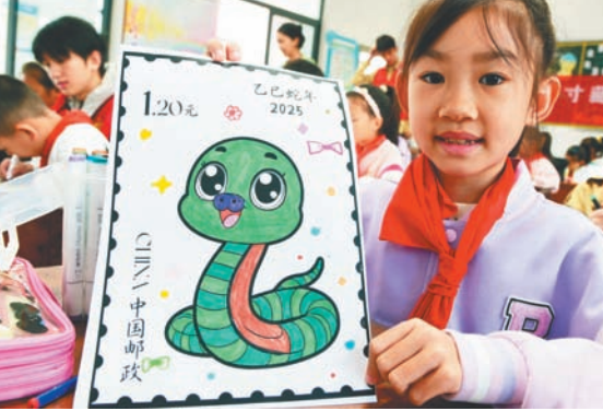
10月9日“世界邮政日”前夕,江苏科技大学志愿者来到镇江市南徐小学开展“蛇年邮票我设计”主题教育活动,指导小学生设计、绘制蛇年生肖邮票,学习邮政知识,感受邮政文化,迎接“世界邮政日”的到来。