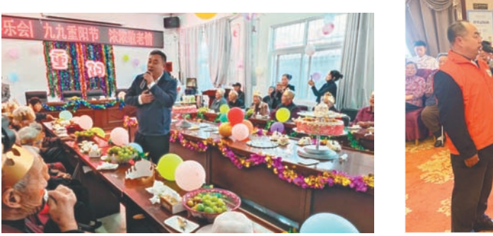
10月10日,徐州工业园区工会开展第五届“重阳劳模工匠喜乐会”主题活动,邀请退休劳模、工匠、职工代表 50 余人,畅谈劳模精神。志愿者们为他们唱响了《当你老了》生日快乐歌,祝愿他们节日快乐。