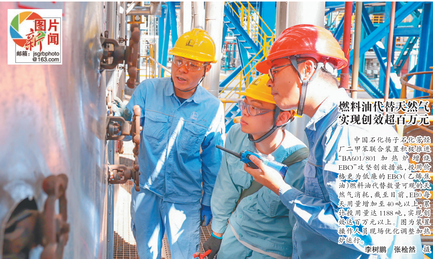
燃料油代替天然气 实现创效超百万元

劝阻其进入装置区工作。在工作和生活中,职工免不了会遇到这样那样的烦心事,如果带着情绪上岗,很容易出现作业效率不高、注意力不集中等问题,不仅关系到个人的精神面貌,更关系到工作中的安全生产。吉林石化公司污水处理厂通过“动态情绪管理”,让心情不好的职工先化解心结再上岗,这是关注职工心理健康的重要举措,体现了对职工的尊重,让职工在工作和生活中更健康、更快乐,同时也是落实安全生产的重要手段,不把“急难险重”工作安排给心情不好的职工,不仅提升了工作效率,更提高了安全系数。职工的情绪管理不是小事,必须要给予充分重视。期待每个企业都能关注员工心理健康,加强对员工人文关怀,及时关注员工的情绪变化,做好思想教育引导,有效防控不良情绪带来的安全风险,确保安心工作、安全生产。