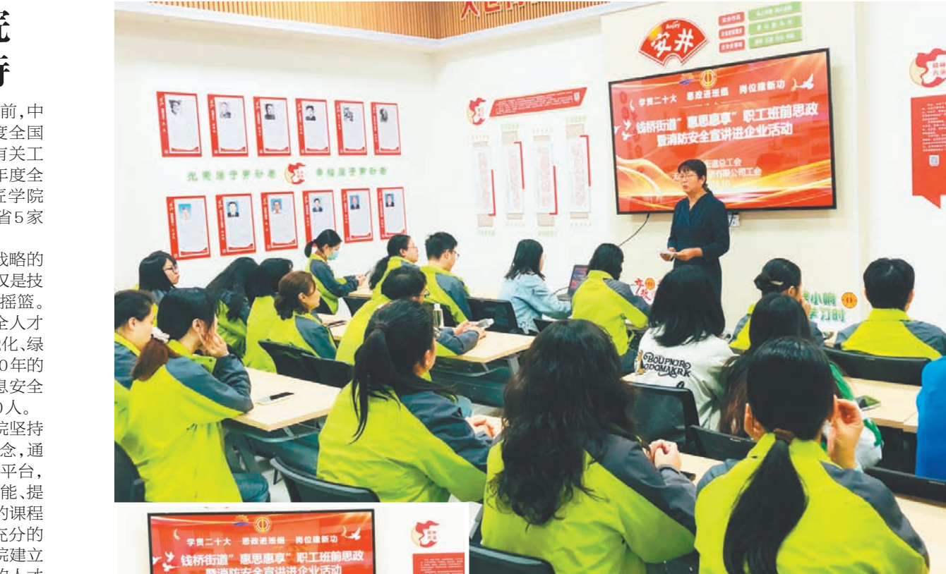
这场企业劳动精神主题馆的职工思政课好精彩

文化底蕴深厚始终是公路养护行业的鲜明特色。阜宁公路中心不仅注重安全便捷通行,更突出公路文化特色,坚持守正创新,以社会主义核心价值观引领文化建设,合理利用公路附属设施,植入公路文化元素,增添公路文化气息,创作擦亮文化品牌,不断增强人民群众对公路行业的认同感,进一步营造全民爱路护路的良好氛围。 朱广美