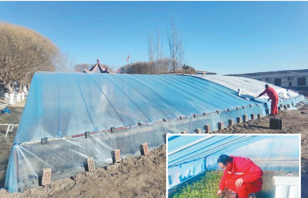
沙漠里蔬菜大棚绿意浓

日前,无锡锡山区先锋爱心义剪志愿服务队、先锋村新时代文明实践站与上海固心健康科技发展有限公司联手,开启“一杯姜茶”暖冬行动。在先锋村的义剪屋前,热姜茶供应点每日准时“上线”,一杯杯热气腾腾的姜茶,为环卫工人、外卖小哥等户外劳动者送去冬日里的一份温暖和爱心。