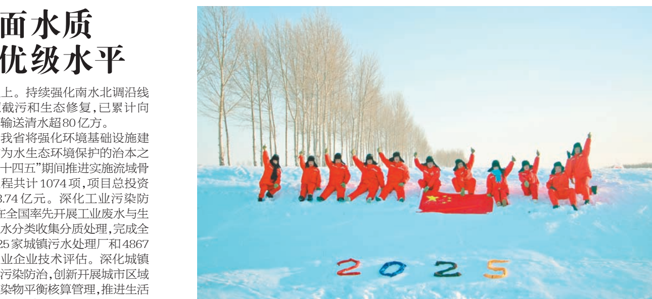
图片新闻 邮箱: jsgrbphoto@163.com