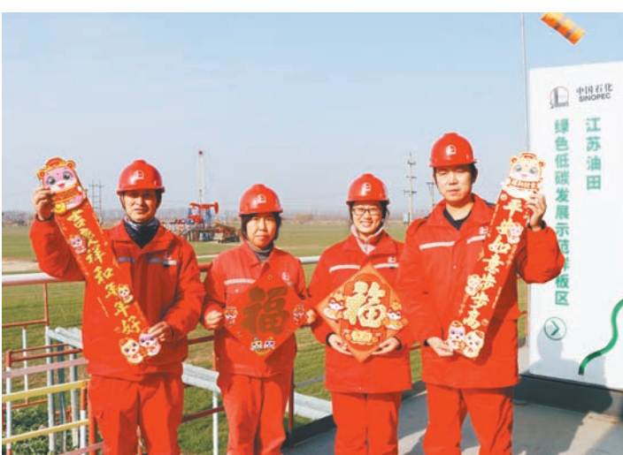
辞旧迎新,在2024年最后一天,江苏油田采油二厂高集生产班站老员工们带着新岗位的大学生们一起动手,把象征红红火火的大红灯笼和象征吉祥如意的窗花,亲手装扮到生产一线,喜迎2025年的到来。 值班主任/徐 颀 版面编辑/艾 臻 本版校对/李小香

新当选的工会主席李亚涛作表态发言,表示将在上级工会的领导下,切实维护职工权益,着力提升货车司机们的归属感和幸福感,进一步促进企业的良性发展。 深圳依时货拉拉科技有限公司南京分公司工会的成立,是江宁开发区总工会落实总关关于头部平台企业建会工作要求的的重要举措,也为维护新就业形态劳动者的合法权益提供了重要保障。接下来,江宁开发区总工会将发挥货拉拉的示范带动作用,不断推进货车司机入会和服务工作,团结引领新就业形态劳动者听党话、跟党走,为持续推动江宁高质量发展走在前、做示范贡献更大的力量。