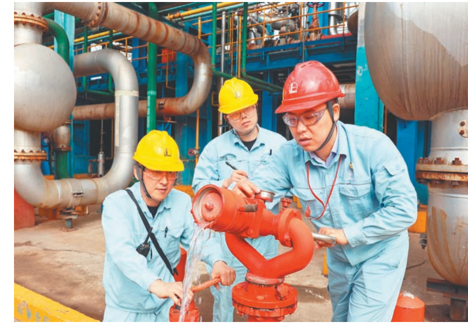
中国石化扬子石化公司重整党支部支委带头承包装置关键部位,党员安全网格监督员参与班组“消防设施”等16类问题安全检查,动态跟踪工艺指标和设备完好性,实现隐患提报、整改、验收闭环管理,护航安全生产。

近年来,南京医科大学立足医学院校特色,选优配齐辅导员队伍,健全培养评价体系,以“五术锻造”为工作抓手,培根铸魂滋养“心术”,精进赋能提高“技术”,精育提质涵养“艺术”,培优提升深耕“学术”,特色培育厚植“仁术”,着力打造一支政治强、业务精、作风正、情怀深的新时代医学生辅导员队伍。 严把选育关,夯实铸魂“心术”。学校坚持将政治标准放在首位,按照“专兼结合、以专为主”的原则选聘辅导员,构建科学规范、衔接有序的辅导员补充机制。抓实选聘过程,注重考察候选人的思想政治素质、职业道德修养和心理健康水平。选齐配强少数民族学生辅导员,选聘兼职班主任、学科辅导员、附院辅导员、调研员辅导员。配好成长导师队伍,培育一支与医学院校学生特点相适应、与新时代学生思想政治教育工作要求相匹配的辅导员队伍。打通辅导员职级、职务晋升通道,选派优秀辅导员挂职锻炼,鼓励优秀辅导员研修深造,在培训进修、评优表彰等方面提供政策支持与条件保障。健全岗前培训、在岗研修、学生满意度测评等长效机制,提升辅导员的政治素养和职业能力。 强化岗位胜任力,锤炼实战“技术”。