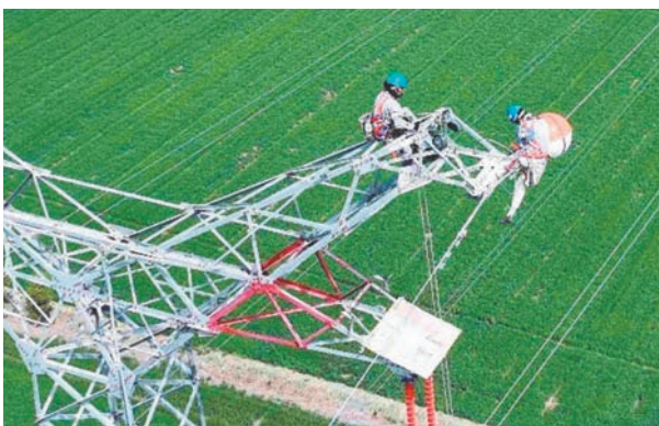
4月17日，国网高邮市供电公司组织作业人员前往高邮经济开发区佛塔村，登上50米高的220千伏祥澄线19号输电铁塔，在顶端光缆处安装两个直径0.6米的防撞球，为东方白鹤觅食飞行构建防护网。

据了解，近3年来，工会牵头申报的各项专利、技术创新成果有30余项，直接产生经济效益1300余万元，节约生产成本660余万元。还有18名一线技术工人晋升为高级技师，309名职工取得了技师、高级工等职业资格证书。