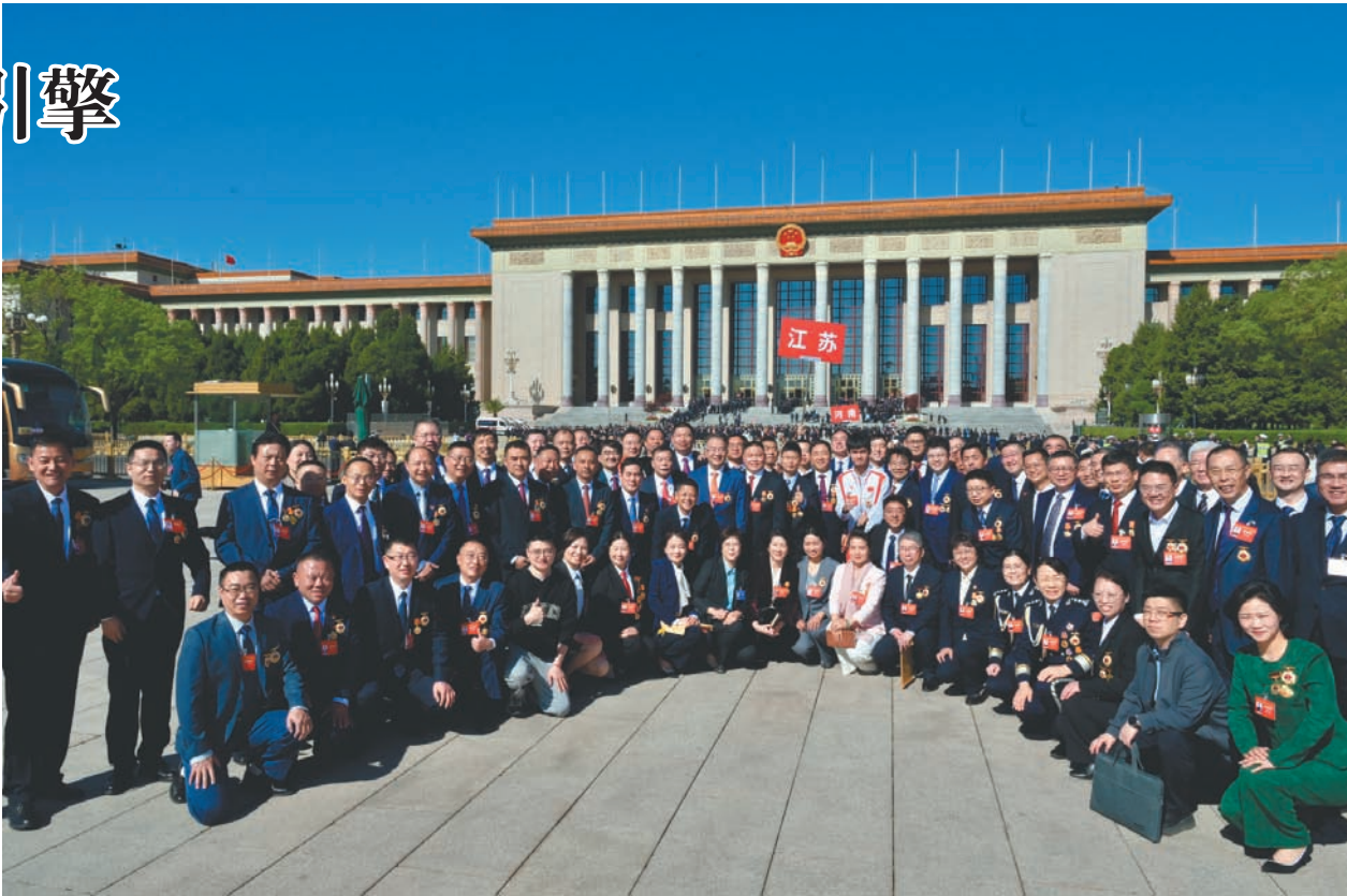
4月28日，庆祝中华全国总工会成立100周年暨全国劳动模范和先进工作者表彰大会在北京举行。江苏共有121人受到表彰，其中全国劳动模范82名、全国先进工作者39名。张旭