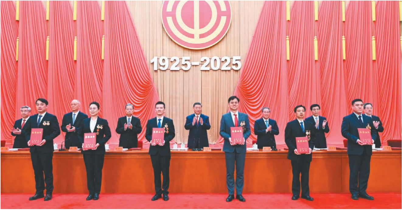
4月28日，庆祝中华全国总工会成立100周年暨全国劳动模范和先进工作者表彰大会在北京人民大会堂隆重举行。这是习近平等党和国家领导人为全国劳动模范和先进工作者代表颁发荣誉证书。

新华社北京4月28日电 庆祝中华全国总工会成立100周年暨全国劳动模范和先进工作者表彰大会28日上午在人民大会堂隆重举行。中共中央总书记、国家主席、中央军委主席习近平出席大会并发表重要讲话强调，新时代新征程，必须紧紧围绕党的中心任务，汇聚起工人阶级和广大劳动群众的磅礴力量，脚踏实地、奋发进取、拼搏奉献，一步一个脚印把实现中华民族伟大复兴的宏伟蓝图变成现实。