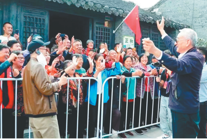
2020年10月，新四军老战士及其后代相聚于黄桥镇再唱《黄桥烧饼歌》