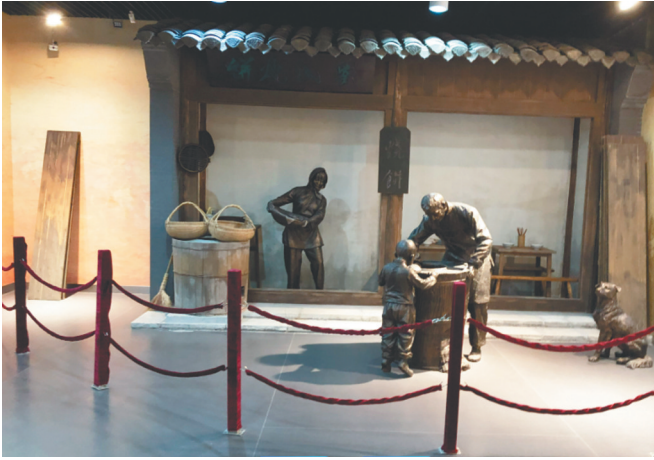
黄桥战役群众支前场景雕像