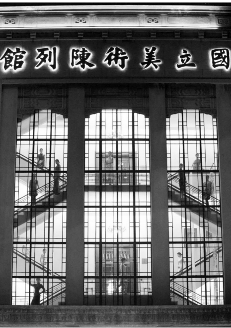
江苏省美术馆陈列馆