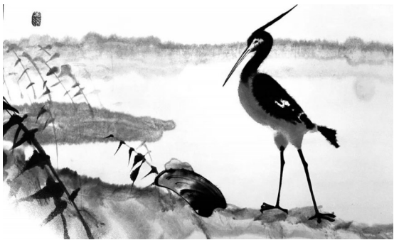
水墨剪纸动画片《鹬蚌相争》经典画面 上海美术电影制片厂出品

展览名称: 东方神韵——中国经典美术片作品及文献展 主办单位: 江苏省美术馆 展览时间: 2021年4月2日——6月20日 展览地点: 江苏省美术馆陈列馆(南京市长江路266号)