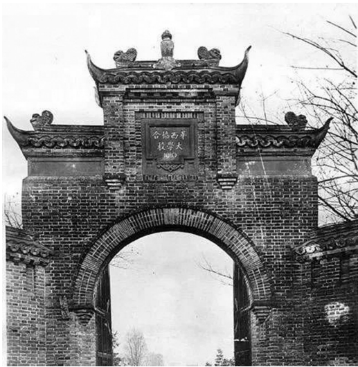
华西协和大院旧影