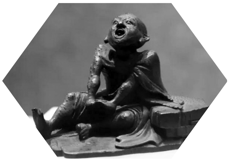
半托迦尊者(罗汉)竹根雕像

竹木牙角器是以竹、木、象牙、犀角为质，施以雕刻而制成的器物。这类器物在中国可谓源远流长。明中期至清代中期(16—19世纪)江南地区，是竹木牙角雕名家辈出、大放异彩的全盛阶段。