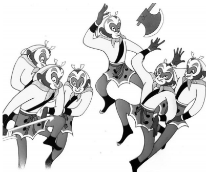
《大闹天宫》孙悟空造型设计 上海美术电影制片厂出品