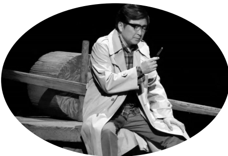
话剧《路遥》往期剧照

话剧《路遥》反映了路遥在生活中的艰难、困顿与烦恼，反映了他对文学创作的追求、曲折与成功。通过路遥思想经历的时代性揭示，试图还原出一位生性耿直敦厚、热爱人民、痴迷文