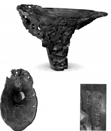
明末清初犀角雕山水人物纹杯

中国传统的竹木牙角雕所承载的江南器具文化，构思于江南士人寄兴山林、以淡泊冷逸作为审美追求的文化精神，成就于江南匠人细腻的心智与灵巧的双手，将文人的情思与手中的刀具汇为一体。通过构思之奇特、立意之高逸、雕刻手法之巧妙，让竹木牙角作品精美自然而富有神韵，在文人士大夫阶层的日常生活中担当重要的角色，不仅开创出中国式的文人雅致生活，而且引领社会风尚，