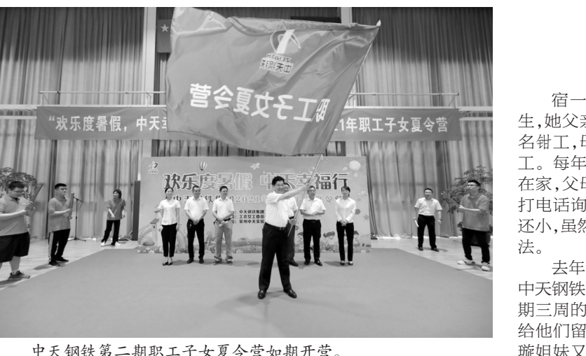
中天钢铁第二期职工子女夏令营如期开营。