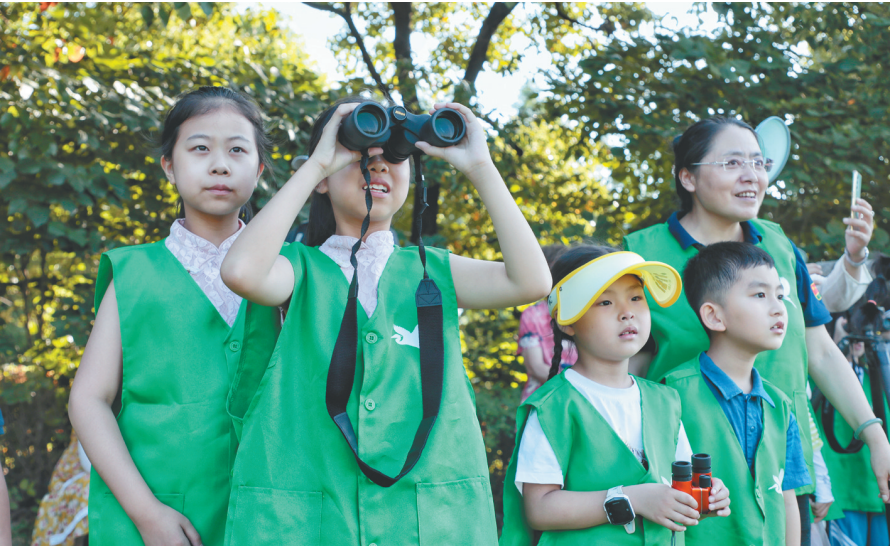
暑假期间，张家港市经开区组织开展野外游学观鸟活动，宣传保护环境、爱护鸟类知识，图为学生们现场体验观鸟。

外国人在我国对国家重点保护野生动物进行野外考察或者在野外拍摄电影、录像，应当经省、自治区、直辖市人民政府野生动物保护主管部门或者其授权的单位批准，并遵守有关法律法规规定。