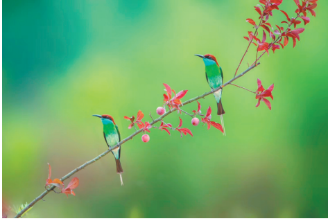
蓝喉蜂虎 摄于安徽霍山