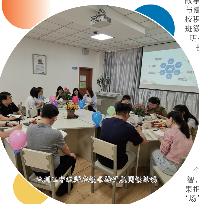
兰州三申教师在读书会开展阅读研讨