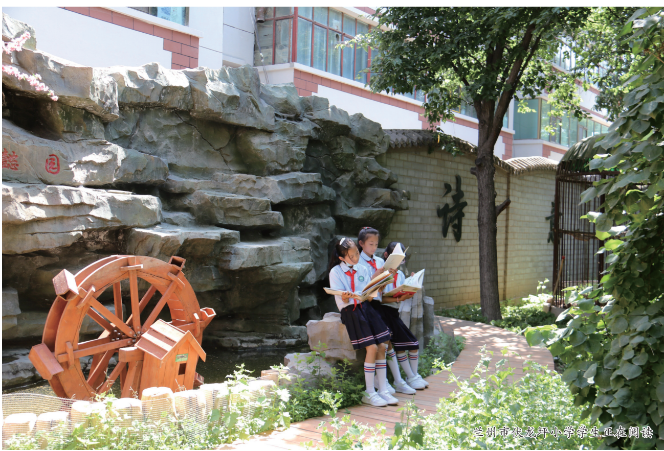
兰州市龙雅小学学生在阅读

“一个人的精神发育史,就是他的阅读史;一个民族的精神境界,很大程度上取决于这个民族的阅读水平。”阅读涵养心智,书香浸润灵魂。新教育强调,“如果把教师比作学生生命发展的重要‘场’的话,那么课程本身就是学生生