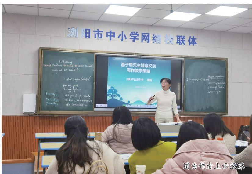
图为作者上课示范照

学反思、发个人公众号的快乐与自信中,每天都有做不完的事,使不完的心。2021年8月成为浏阳市初中英语名师工作室首席名师后,我做了一个决定:放下不擅长的班主任工作,专注于英语教学教研工作。因为我认定,英语教育教学才是我一生努力的方向。