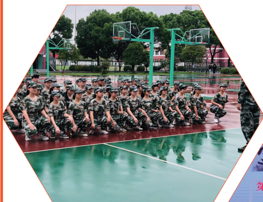
图为该校新生军训

望亭中学现有立项的“十四五”课题共20项,包括省级课题3项,市级课题5项,区级课题12项。