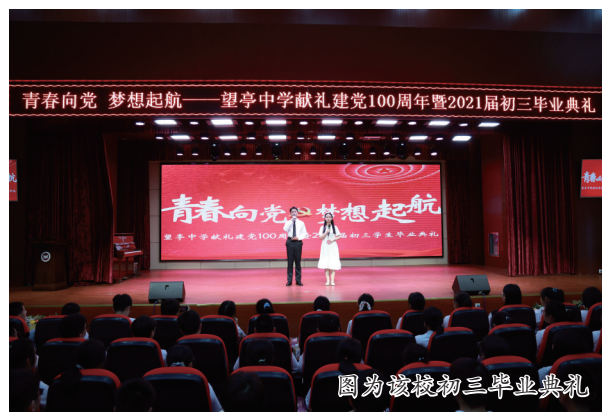
图为该校初三毕业典礼