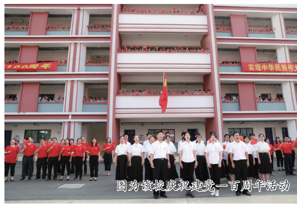
图为该校庆祝建党一百周年活动

体育方面,在相城区中小校园足球联赛中,望亭中学高中男子组连续3年获得第一名、初中男子足球队获得第二名,2021年相城区中小学生篮球比赛获得第一名,冬季三项比赛中高中部获得团体总分第一名,2021年学校被评为江苏省校园足球先进学校。2022年,学校在相城区校园文化艺术节合唱比赛和朗诵比赛中均获得一等奖。近3年来,在省市区各级各类比赛中获奖的学生超过1100人。