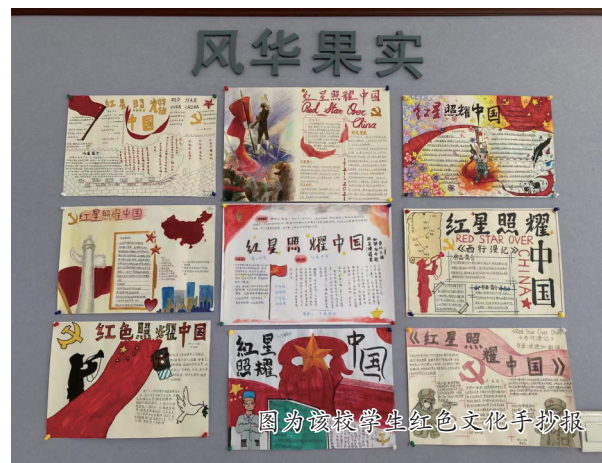
图为该校学生红色文化手抄报

今天的望亭中学校园,处处洋溢着人文气息。2020年,在苏州市“三话”比赛中,学校获得高中组团体一等奖。在相城区第二十届中小校园文化艺术节中,合唱比赛和器乐队比赛均获得一等奖。