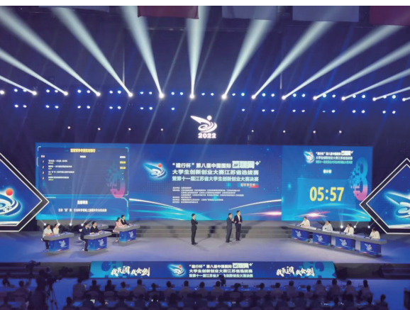
2022年7月16日至19日,第八届中国国际“互联网+”大学生创新创业大赛江苏省选拔赛在南京农业大学举行。