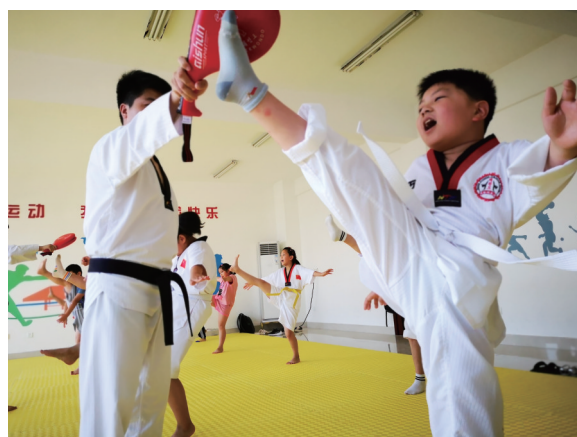
2022年8月,如东县马塘镇学生在该镇乡村振兴少年宫暑期托管班学习跆拳道。