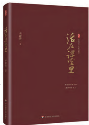
《活在课堂里》 李政涛 著 华东师范大学出版社

多年前,南通市通州区组织“名师之路”教育科研协会会员赴华东师范大学学习时,我有幸聆听了中国教育学会副会长李政涛的讲座,令我印象深刻的是,他不用现成的PPT,而是将“关键词”一个个地输入电脑,有条不紊地将知识讲述给听众。从那时起,我便开始读他的书。近期,我阅读了李政涛的《活在课堂