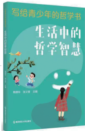
《写给青少年的哲学书》 陶德华 张义修 主编 南京师范大学出版社

当今世界正经历百年未有之大变局,科技发展日新月异,社会观念日益多元。在这样的时代背景下,青少年需要具备什么样的能力和素养才能从容应对未来的挑战?我认为,哲学素养是不可或缺的。哲学能够帮助青少年构建理性思考的框架,从而在纷繁复杂的信息中,明辨是非,做出独立判断;树立正确的世界观、人生观、价值观,从而明确人生目标,找到生命的意义;培养思辨精神,形成批判性思维,从而不盲从、不迷信,敢于质疑,勇于创新。因此,对青少年进行哲学教育是时代发展的迫切需求。