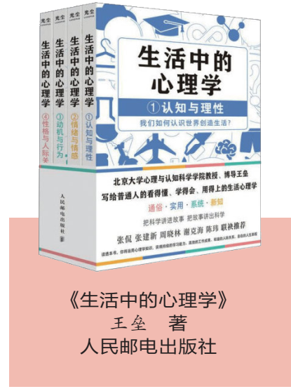
《生活中的心理学》 王垒 著 人民邮电出版社

《生活中的心理学》最动人的地方,在于其“温柔的解构”。它不鼓吹对抗或改变,而是教人如何与矛盾共存。例如“冲突的阶梯模型”指出,人际摩擦从观点分歧到身份攻击的每一步,都可被拆解与修复。某次与合作伙伴因方案争执