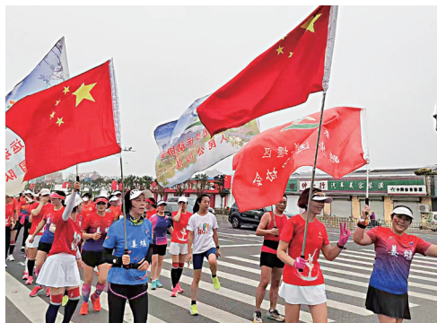
日前,区跑步协会组织80名跑友手擎国旗,一起长跑10.1公里,以运动的方式庆祝新中国73华诞。

学、研、用”相结合,使生产边际利益最大化,切实为企业减负助力,让企业引得进、留得住、发展得好。