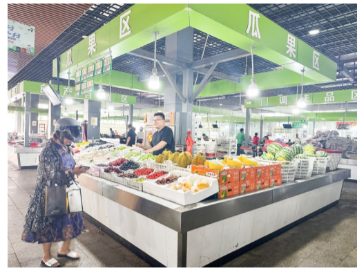
随着气温不断攀升,不少夏季时令水果扎堆上市,我区水果市场出现“百果争香”的场面,极大丰富了市民“果篮子”。

为了帮助学生更快地融入姜堰二中这个大家庭,该校召开“启航新征程 共绘未来梦”2024级高一新生入学大会,介绍近年来办学情况,分析高中阶段学习特点,对高一新生暑期学习和生活提出要求,帮助他们明确未来的学习方向,共同开启一段精彩纷呈的高中生活。