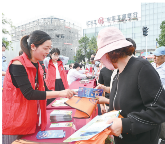
日前,区科协联合区委宣传部、区科技局等10多家部门单位开展“提升全民科学素质 助力建设科技强国”主题的2024年姜堰区“全国科普日”暨第33届科普宣传周主场活动。

稻麦科技小院位于姜堰井贤种植家庭农场,在扬州大学、区农业农村局的支持下,该小院为江苏稻麦科技创新与产业可持续高质量发展提供了典型样板。