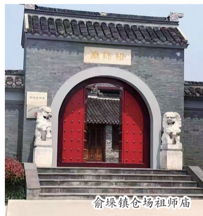
俞垛镇仓场祖师庙