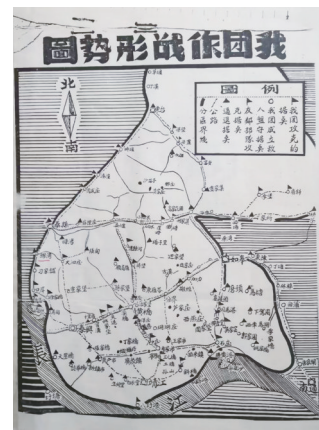
泰县独立团作战形势图

这三次围绕姜堰镇的激烈战斗,生动而深刻地反映了国共两党在特定历史时期的政治博弈、军事对抗以及战略决策的演变,同时也充分展现了共产党领导下的人民军队和广大群众为了自由、解放和正义,不畏强敌、英勇奋战、坚韧不拔的革命精神,在国共斗争的历史长卷中留下了浓墨重彩的一笔,也为后世研究这段历史提供了翔实而鲜活