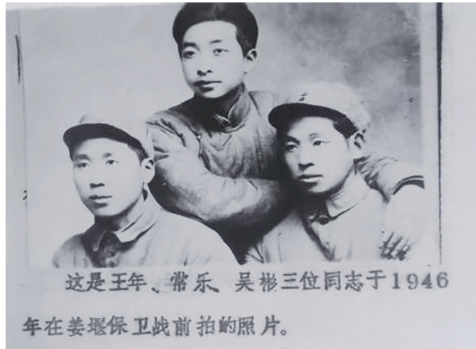
三名同志1946年在姜堰保卫战前夕拍摄的照片

一部(分区特务团)奉命突袭姜堰,上级要求“在两天两夜内结束战斗”。此时,姜堰镇已被国民党军苦心经营为萃丰核心据点,驻有国民党泰县保安团一、四两个大队和特务中队以及三个区常备队,总计1200余人,配备了4门迫击炮、2挺重机枪和40挺轻机枪,防御工事极为坚固。