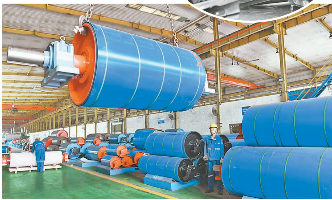
3月5日,焦作科瑞森重装备股份有限公司工人在生产起重输送装备。该公司是我国散料连续输送装备行业较为突出的企业。经过发展壮大,目前该公司主营产品已有五大类20多个系列300多种成套设备,在马来西亚、巴基斯坦、巴西等30多个国家实施工程总承包项目。