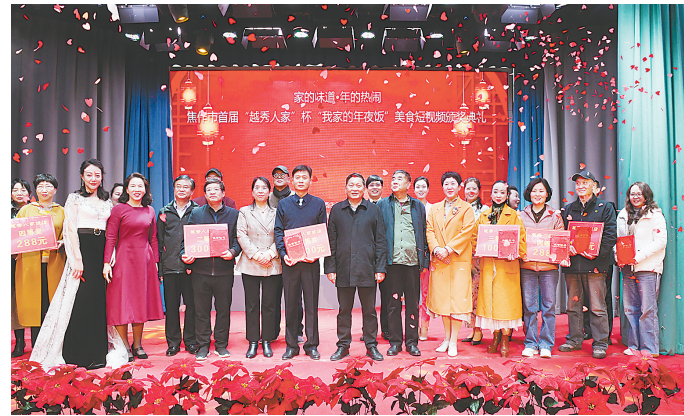
3月6日,市首届越秀人家杯“我家的年夜饭”美食短视频大赛颁奖典礼在市融媒体中心文化产业园举行。本次大赛共收到参赛作品41件,经过大赛评委会的认真评选,有16件作品分获一、二、三等奖和优秀奖。

(上接A01版③)五年来,北山生态环境修复和建设的高压严打态势已成常态。项目稳步推进。山水林田湖草生态修复治理项目投资3.7亿元,在北山启动了29个矿山地质环境治理项目,目前主体工程已全部完工,正加快推进验收工作。其中,投资1.24亿元的山阳区山门河一带矿山地修复治理项目,治理面积1.5万平方米,现已全部完工,种植樱桃、山楂、核桃、冬桃等经济树木,增加了当地农民收入;解放区老丁沟一猫岔一影路路,增加了当地农民收入;北同河一带矿山地地质环境治理项目,与附近的花海广场、南太行健身步道、民宿设计等有机联接;投资1.13亿元、治理区面积约2.9万平方米的中站区龙翔山公园,依托矿区浑然天成的地质风貌和陶瓷文化,以矿区改造为基础,开发矿区内的商业服务、商务办公、休闲娱乐等现代矿公园功能,设计理念为打造“一脉、三区、八园、三十点”矿山修复治理典范和能够体现我市新形象的矿公园。