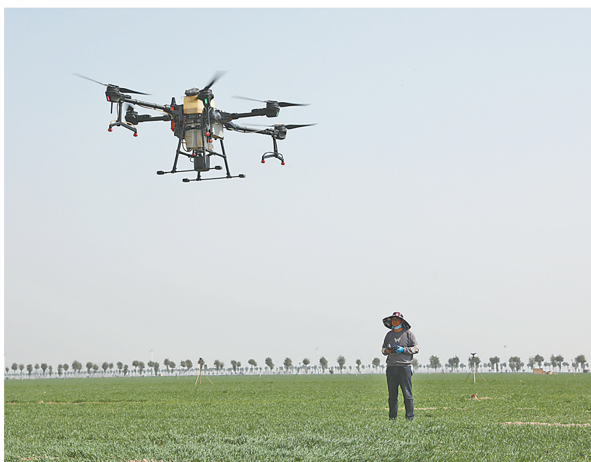
3月8日,温县招贤乡仓头村农民在麦田间用植保无人机喷洒除草剂。时下气温回暖,正值春耕春管时节,田间地头一派农忙景象。

市商务局负责人介绍,市财政将安排1000万元专项资金,通过焦作中旅银行对在活动期间购买新车的个人消费者以事后补贴的形式发放至个人,先到先得,发完即止。需要注意的是,五种情况不在本次补贴范围,一是党政机关、企事业单位购买新车的;二是在活动公告发布前已经开具机动车销售统一发票,在活动公告发布后更换或重新开具发票的;三是购买摩托车、三轮车、四轮低速电动汽车、农用车辆的;四是在本地区享受过同类型补贴的;五是购买价税合计30万元以上新车的。