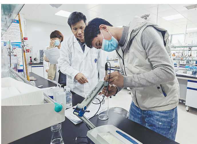
食品生产企业的食品检验人员在进行能力考核。

活动自本月启动后,逐月分别对饮料、肉制品、方便食品、调味品、糕点膨化食品等食品行业进行考核。考核采用全免费方式,针对考核不合格者,企业要对食品检验人员进行培训,经市市场监管局再次考核,合格后方可重新上岗。