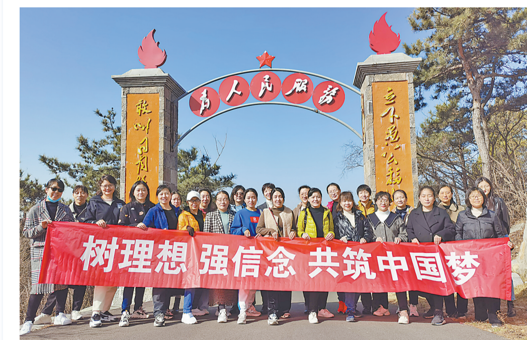
为进一步深化中国特色社会主义和中国梦宣传教育,在今年三八节来临之际,市市场监管局组织机关女职工前往红色教育基地——博爱县知青村开展“树理想、强信念、共筑中国梦”主题活动。通过参观知青旧居、重温入党誓词、献唱红色歌曲、观看红色影片等活动,感知知青与当地村民团结一心、同甘共苦、共筑美好家园的历史。