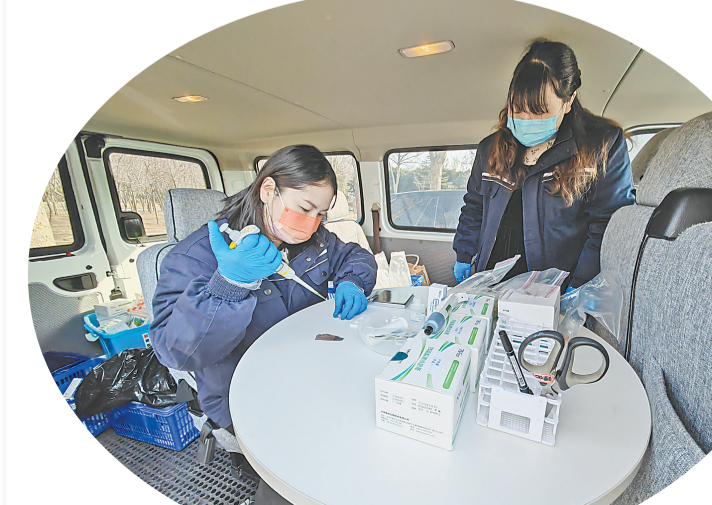
全市两会召开在即,市市场监管局提前介入,对两会保障宾馆开展食品安全抽检。此次抽检采取现场快检形式,市、区两级市场监管执法人员联合专业第三方抽检机构在焦作迎宾馆后厨,抽取了煎炸油、猪肉、豆芽、芹菜、包菜等5批次样品后,回到快速检测车进行现场检测。经过测试,该批次样品检测结果均合格。