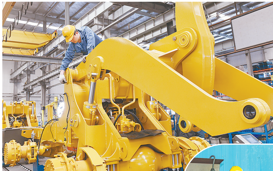
7月23日,厦工机械(焦作)有限公司的技术工人在组装装载机。该公司持续提高周边产业配套能力,通过技术创新打造数字化、网络化、智能化工程机械制造园区,目前已完成焦作公司数字化工厂规划、核心运营系统整改等13个MES软件实施项目。

此次大赛由焦作高新区承担焦作分赛区的赛事组织工作,为企业提供全流程高标准服务。一是高标准动员。焦作高新区从国家科技型中小企业库中筛选符合条件的企业组织申报。二是高标准走访。焦作高新区科创部门工作人员赴创新创业载体调研,积极组织企业参赛,指导完善申报材料,提升路演水平。三是高标准对接。焦作高新区与省、市创新创业大赛组委会精准对接,及时落实反馈意见,指导企业查漏补缺、高效参赛。