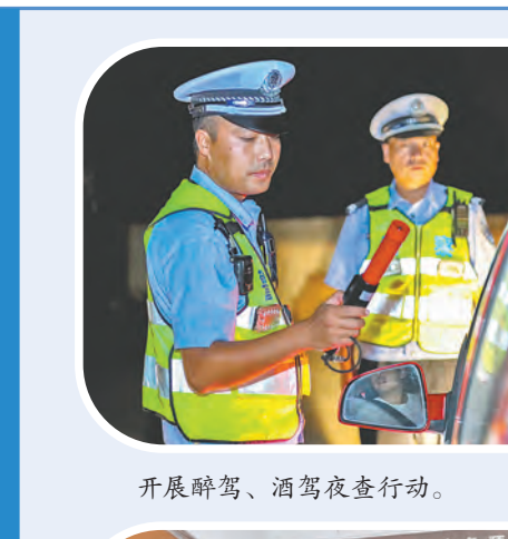
开展醉驾、酒驾夜查行动。