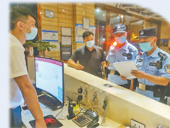
民警在某娱乐场所开展清查工作。