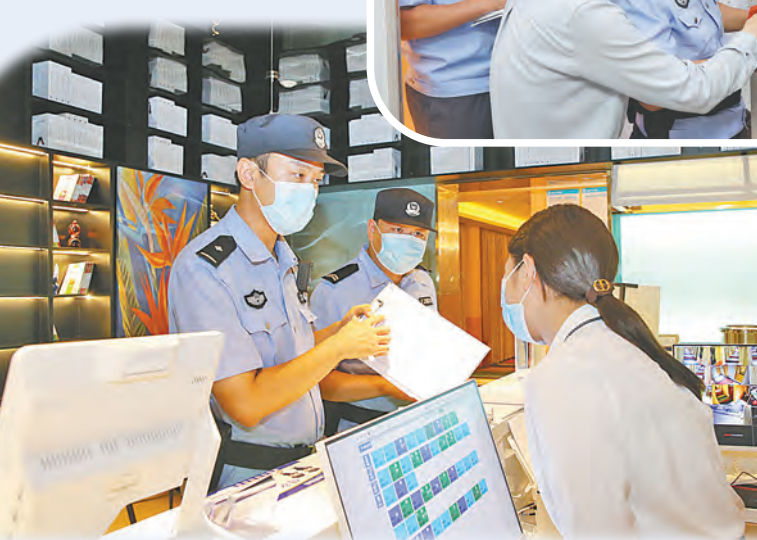
民警在某场所开展清查工作。