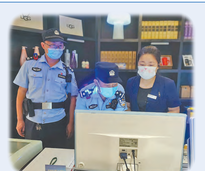
民警在某旅馆开展清查工作。

名,捣毁生产、仓储窝点6处,查封假劣药品100余万瓶,涉案金额高达2000余万元。示范区公安成功摧毁一个恶势力犯罪集团。 全市公安机关在“夏季治安巡查宣防集中统一行动”中,发放宣传资料84000余份,排查整改各类安全隐患360余处,抓获犯罪嫌疑人103名,查处酒驾19起、醉驾20起。“百日行动”以来,全市治安案件同比下降22.5%、刑事案件同比下降37%,取得了良好社会效果,人民群众的安全感、满意度不断增强。