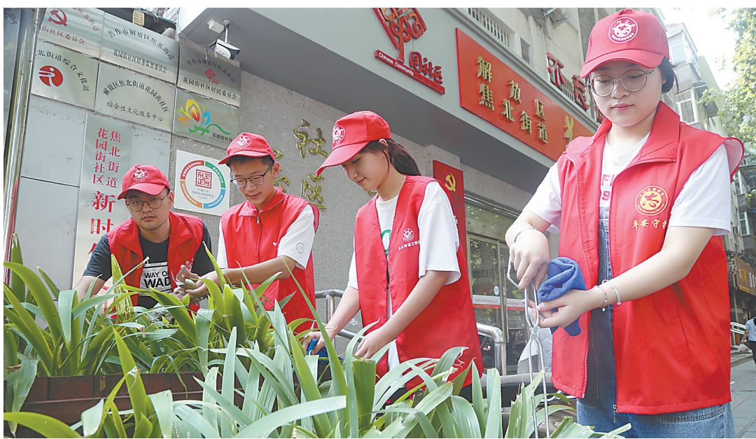
8月7日,解放区焦北街道花园街社区的志愿者在捡拾绿植中的垃圾。连日来,高温天气挡不住“志愿红”清洁城市的脚步,解放区组织机关干部、企事业单位工作人员成立志愿者服务小分队,大家变身城市“美颜师”,用汗水提升城市“颜值”。