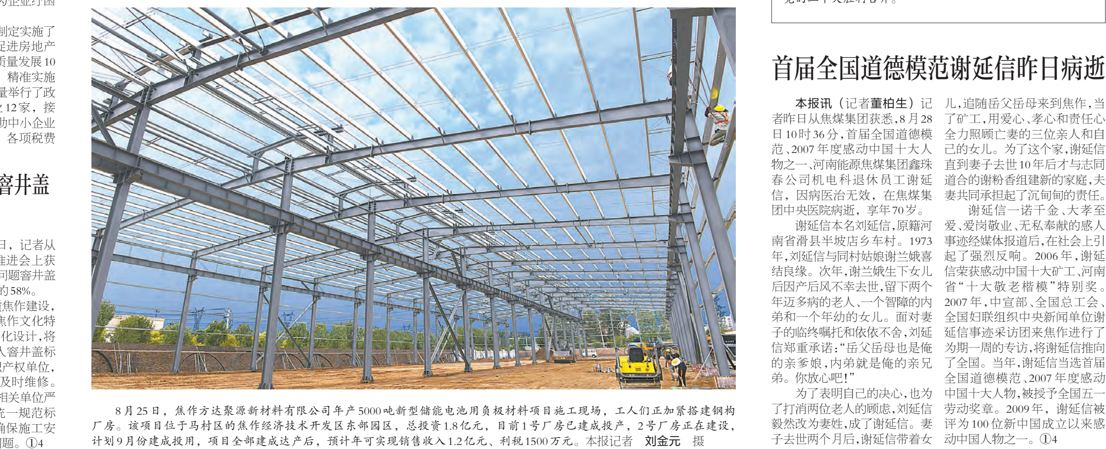
8月25日，焦作方达聚源新材料有限公司年产5000吨新型储能电池用负极材料项目施工现场，工人们正加紧搭建钢结构厂房。该项目位于马村区的焦作经济技术开发区东部园区，总投资1.8亿元，目前1号厂房已建成投产，2号厂房正在建设，计划9月份建成投产，项目全部建成达产后，预计可实现销售收入1.2亿元、利税1500万元。