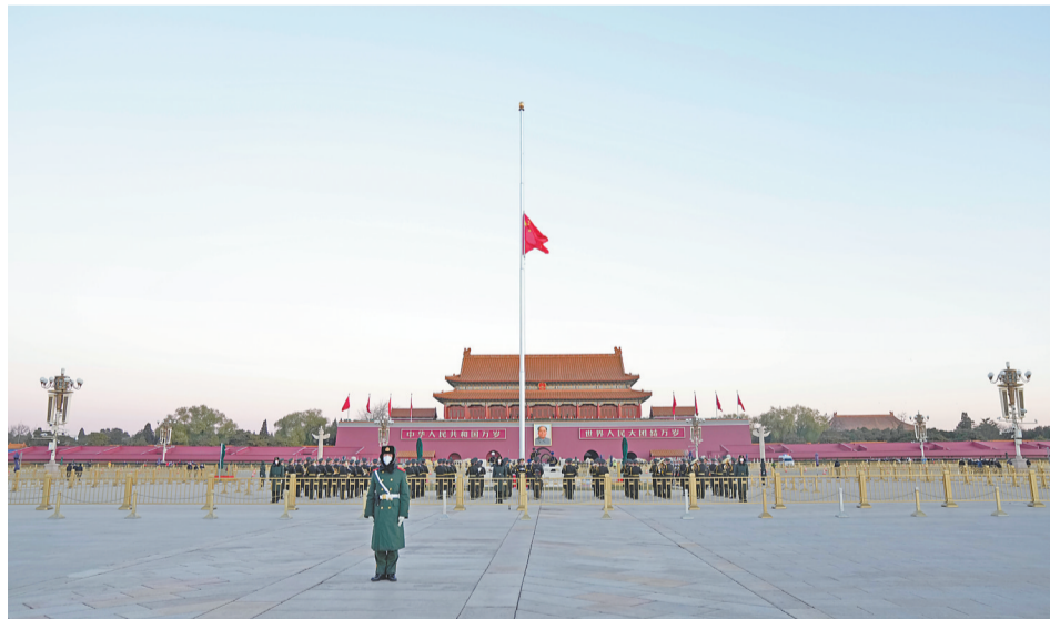
12月1日，北京天安门下半旗志哀，悼念江泽民同志逝世。

江泽民同志是我党我军我国各族人民公认的享有崇高威望的卓越领导人，伟大的马克思主义者，伟大的无产阶级革命家、政治家、军事家、外交家，久经考验的共产主义战士，中国特色社会主义伟大事业的杰出领导者，党的第三代中央领导集体的核心，