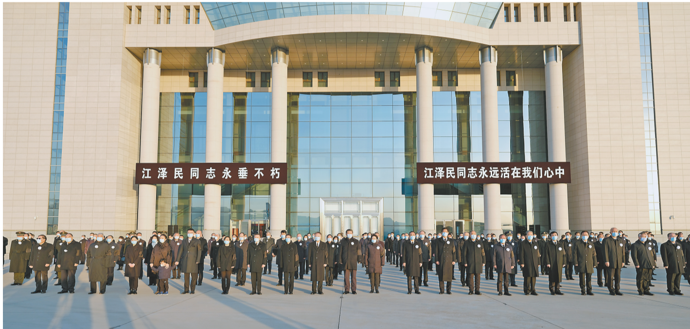
12月1日，江泽民同志的遗体从上海由专机敬移到达北京。习近平、李克强、栗战书、汪洋、李强、赵乐际、王沪宁、韩正、丁薛祥、李希、王岐山等党和国家领导同志到北京西郊机场迎灵。蔡奇等从上海护送江泽民同志遗体回到北京。

新华社北京12月1日电 我党我军我国各族人民公认的享有崇高威望的卓越领导人，伟大的马克思主义者，伟大的无产阶级革命家、政治家、军事家、外交家，久经考验的共产主义战士，中国特色社会主义伟大事业的杰出领导者，党的第三代中央领导集体的核心，“三个代表”重要思想的主要创立者江泽民同志的遗体今天从上海由专机敬移到达北京。习近平、李克强、栗战书、汪洋、李强、赵乐际、王沪宁、韩正、丁薛祥、李希、王