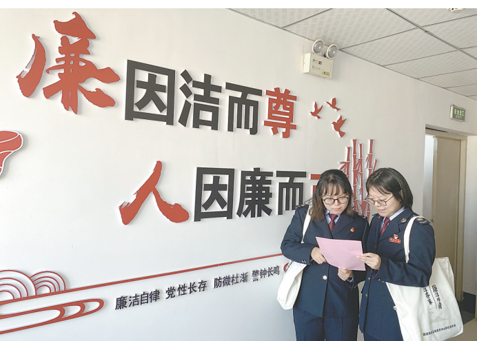
图为山阳区税务局廉洁文化墙。

袋上,打造行走的廉洁文化阵地,使全局干部职工广泛参与廉洁文化建设,成为廉洁文化的宣传使者,让廉洁从家观念深入人心。除此之外,该局在“常”和“长”上下功夫,打造廉洁文化走廊,发放廉洁倡议书,开展廉政亲情寄语、入职廉政“第一课”等活动,让廉洁文化内化于心、外化于行,充分发挥廉洁文化教育、引领和浸润作用,教育引导干部职工自觉抵制腐败侵蚀,夯实廉洁从家的思想根基,厚植廉洁文化土壤,筑牢反腐倡廉防线,让廉洁成为干部职工修身齐家从家的鲜明底色。