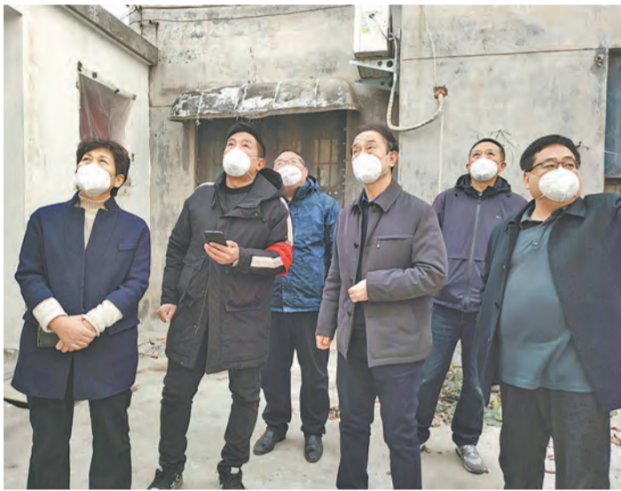
调研组在察看一家危房改造情况。