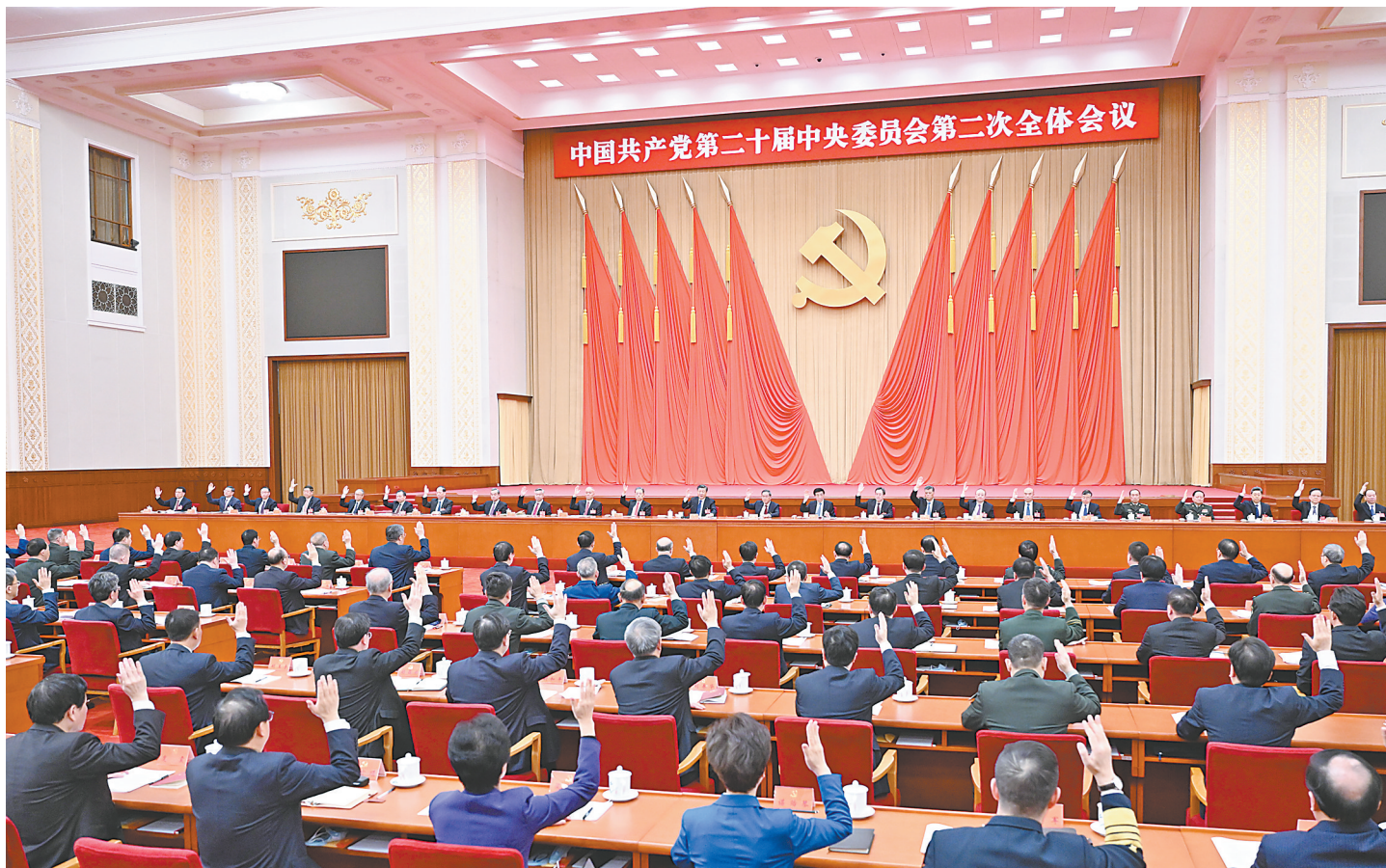
中国共产党第二十届中央委员会第二次全体会议，于2023年2月26日至28日在北京举行。中央政治局主持会议。