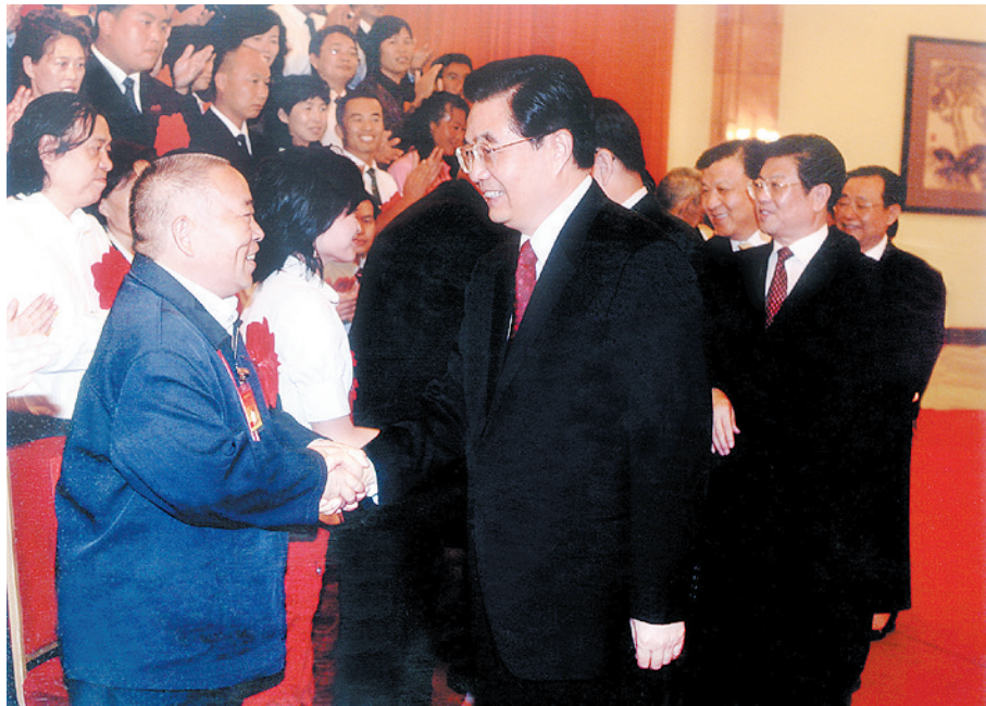
2008年9月9日,时任中共中央总书记、国家主席、中央军委主席胡锦涛到博爱县清化中学考察。(本报资料照片)