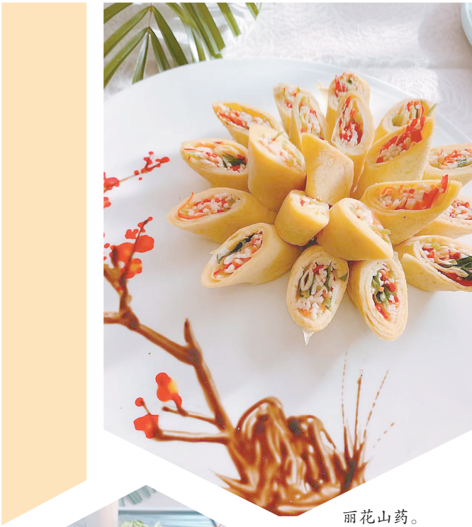
丽花山药。

持续拉动文旅消费。完善文旅消费场景，以文旅市集为载体，布局一批老字号、品牌餐饮等特色美食店，引导各大文旅市集“引摊入店”，培育打造文消费集聚区与文旅休闲街区。提升完善夜游影视城、大沙河（盆景园）、云溪谷等夜游项目，谋划推出更多更优的夜游产品，每个县（市、区）要至少推出1个经典夜游产品。创新提升文创产品，推动焦作文创产品设计大赛获奖作品市场化运作，尽快构建具有焦作特色的文创产品体系；要打磨提升《印象·太极》、高塔实景演出、云台山竹林七贤国风演艺等沉浸式演艺，增强产品吸引力。积极发展数字文旅，加快国家方志馆南水北调分馆、韩愈景区数字化展览馆、朱载堉纪念馆等8个数字化项目建设步伐，推动尽快建成投运。