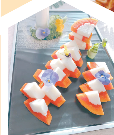
椰奶木瓜山药。

本报讯（记者赵改玲）千年贡礼，一品药膳。11月1日，在太极故里、怀药之乡温县，举办了第一届全国山药产业发展大会暨第十三届温县铁棍山药文化周开幕式。这既是温县贯彻党的二十大精神，落实省委“十大战略”、市委“1353”决策部署，打造特色农业之乡的必然要求，也是温县做精“土特产”文章、助力推动乡村振兴的一次重要实践。