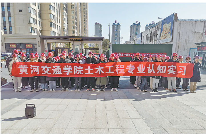
黄河交通学院土木工程专业学生在和兴鑫悦府项目参观学习。