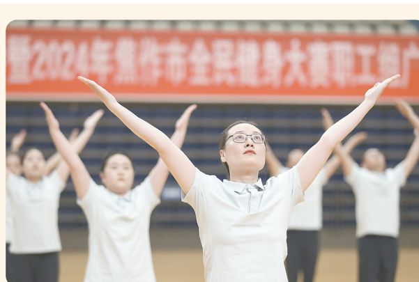
广播体操整齐划一。

6月29日、30日，职工组象棋比赛和职工组乒乓球比赛分别在市体育局机关三楼会议室和市太极体育中心健身馆举行；7月1日，职工组太极拳比赛在市太极体育中心太极拳馆举行。丰富多彩的赛事为全市职工群众提供了展示自我、交流技艺的平台，激发了广大职工群众参与全民健身的热情，为全市体育事业健康发展注入了新活力。