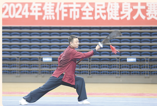
太极比赛刚柔相济。