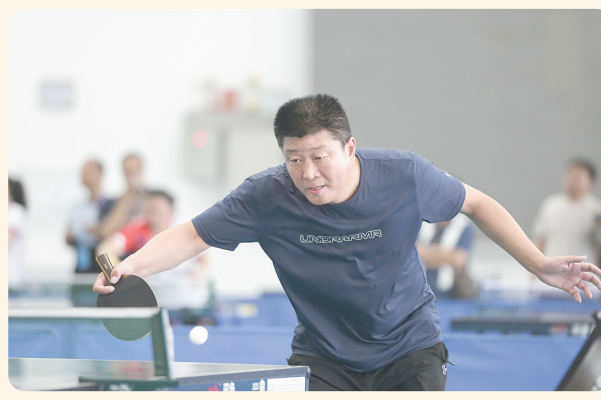
乒乓对决严阵以待。