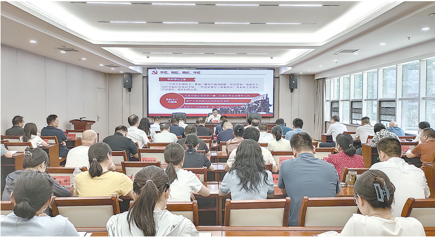
市自然资源和规划局庆祝建党103周年暨“七一”表彰大会会场。