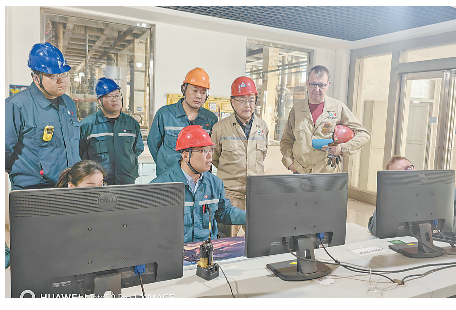
龙佰集团钛业二车间党员技术团队与国外专家交流学习。